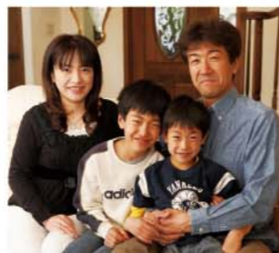
素敵な洋館にお住まいのFさん家族。とても気持ちよく暮らしているそうです。