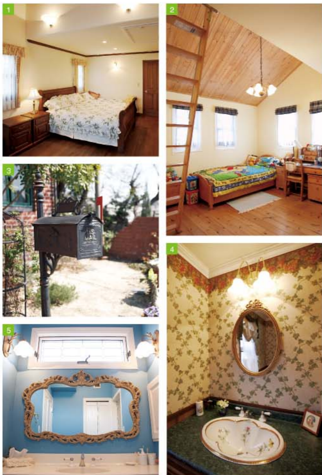
1/寝室もゆとりのサイズ。奥にはウォークインクローゼットを設けています。2/子ども部屋はパイン材でナチュラルな空間に、机などもテイストを合わせています。3/郵便受けのデザインも雰囲気を大切に選ばれています。4/トイレの洗面ホールは、手書きの絵があしらわれた海外の高級ブランド品です。5/優雅なデザインの鏡や照明が印象的な洗面室。窓ガラスにも伝統の趣が漂っています。