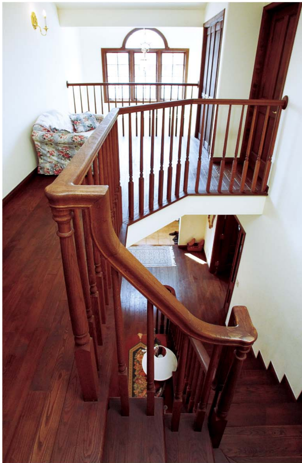
上/陽光が感じられるファミリースペースにも、空間的なゆとりが感じられます。 下/ファミリースペースには本棚を設置。読書には最適な空間になっています。

「レンガ積み調の外観は、年月を経ても古さを感じません。室内の塗り壁(ドライウォール)は、いずれ塗り替えればいいと思っています。全然飽きが来ないのが、この家の魅力でしょうか」。