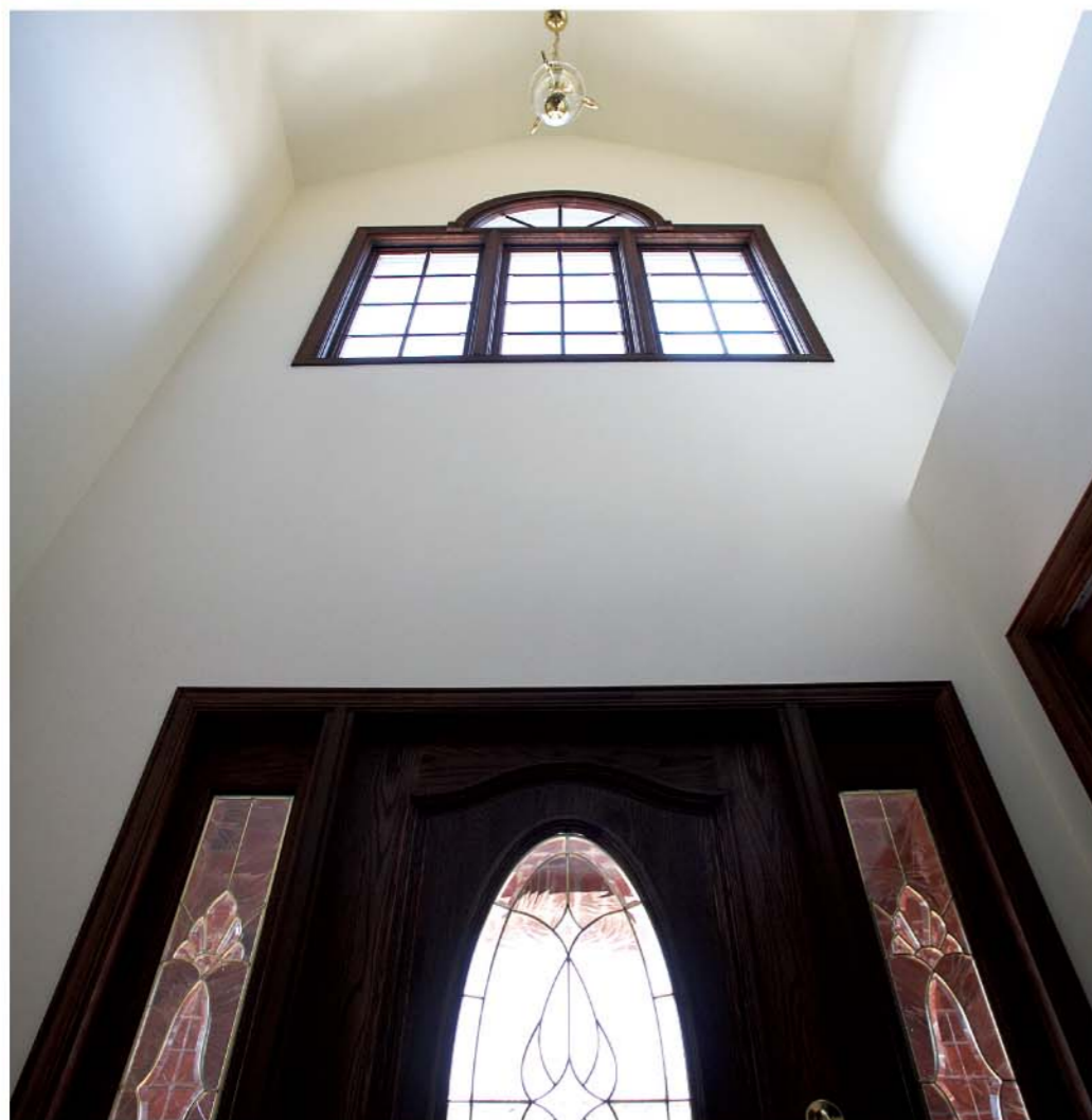
右頁／レンガ約10,000個が使われたという外観。左右対称のデザインが美しい佇まいです。 左上／外灯のデザインにも奥さんのこだわりが。豊かな表情を演出しています。 左下／玄関は吹き抜けになっています。玄関ドアのデザインもエレガントです。