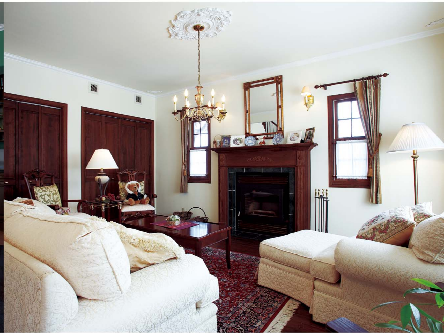
優雅な雰囲気が漂うリビング。マンテルピースや窓枠など、影のあるデザインが好きだそうです。

※/収納なども英国調の趣でまとめています。 ※/キッチンから見たダイニングも優美です。