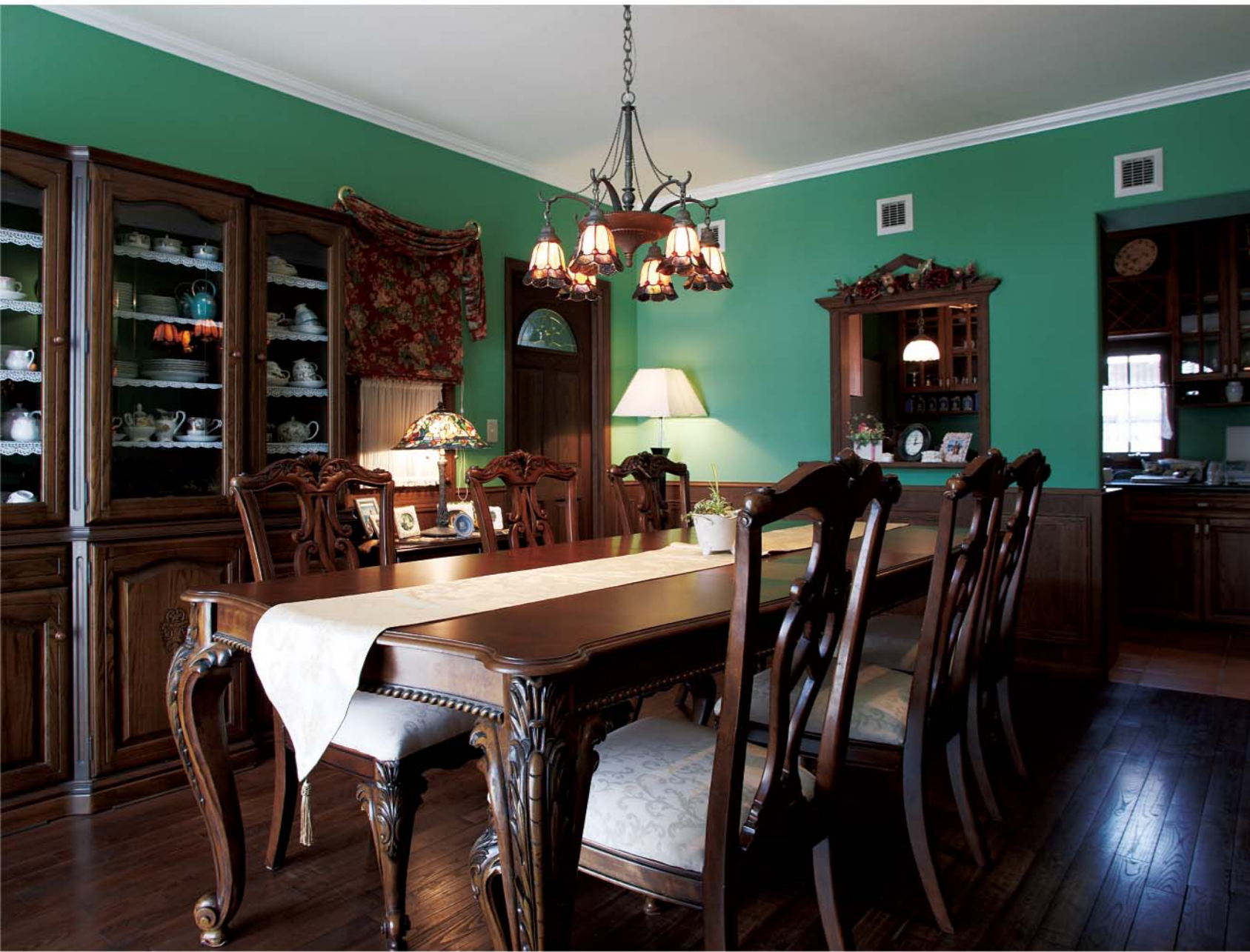
ダイニングの壁はグリーンに、ダークな家具とのコントラストが鮮やか印象です。